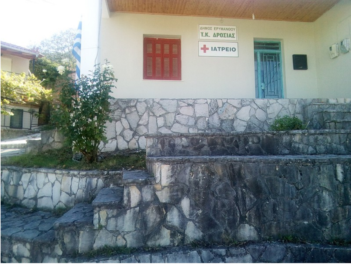
Το οίκημα του Ιατρείου που ετοιμάζουμε με την δική σας συνδρομή